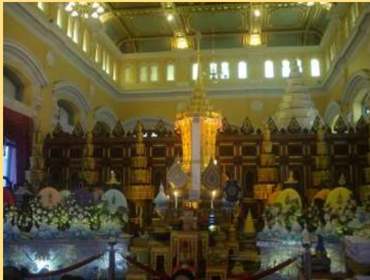
พระโกศกุดั่นใหญ่ประกอบพระอิสริยยศพระศพสมเด็จพระญาณสังวร (เจริญ สุวฑฺฒโน)